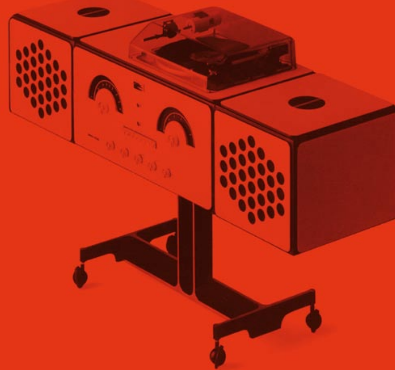
ts 522 RC

SOPRA: IL RADIOFONOGRAFO RR 126 (1965) DI ACHILLE E PIER GIACOMO CASTIGLIONI IN CENTRO: MARCO ZANUSO E RICHARD SAPPER SOTTO: LA RADIO RR (1965) E LA TS 522 DI ZANUSO E SAPPER